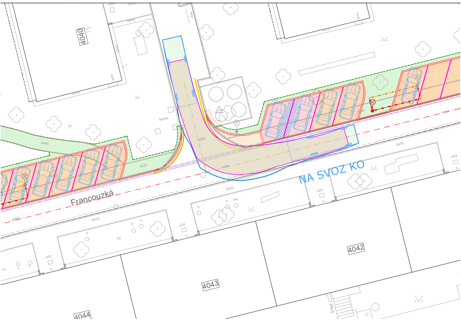
Vlečná křivka - vyjetí